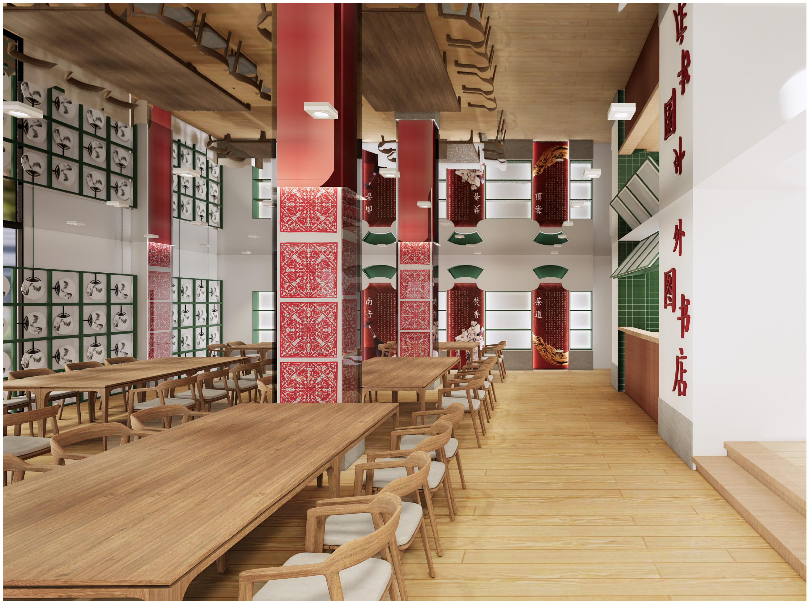
体验区、展示区方案