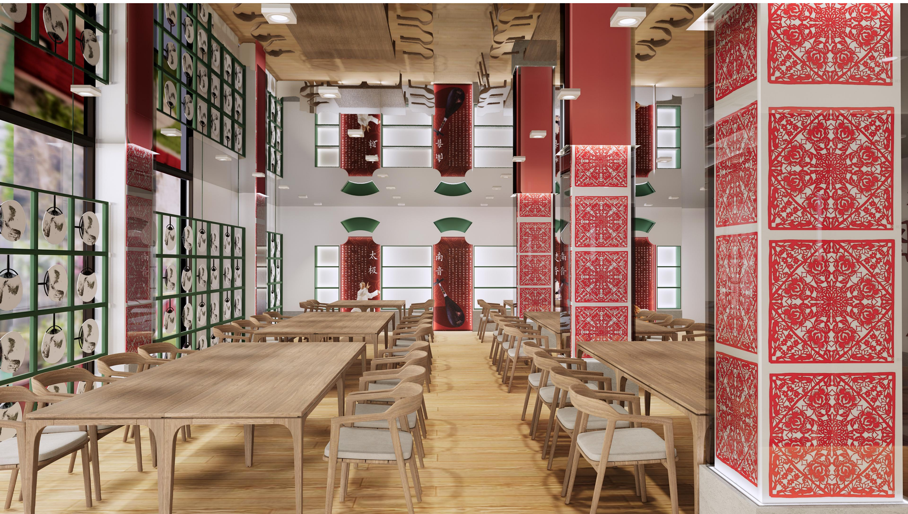
体验区、展示区方案